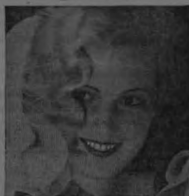
Juno Vlassk de Fox Pictures

ble que puedan contar con el servicio de cañería, problema que está pendiente de solución desde hace mucho tiempo. Puedo agregar, nos dijo uno de nuestros interlocutores, que si la Municipalidad nos exime del pago del canon, nosotros todos pagaremos el impuesto trimestral, y a ese fin van bien encaminadas las gestiones que hacemos.